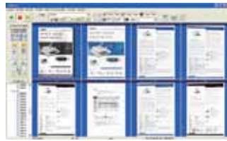
The AvScan X main screen

-La Herramienta inteligente para el manejo de sus escaneos