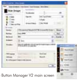
The Button Manager V2 main screen

Button Manager V2 facilita el proceso de escanear y enviar sus documentos a sus destinos favoritos con sólo presionar un botón. La nueva versión viene con una innovadora característica que le permite escanear y enviar automáticamente el archivo a servicios populares como Google Docs, Microsoft SharePoint, o a un FTP. Además, iScan permite insertar la imagen escaneada o el texto reconocido (con un proceso OCR opcional) en su editor de texto preferido, como Microsoft Word para optimizar su flujo de trabajo.