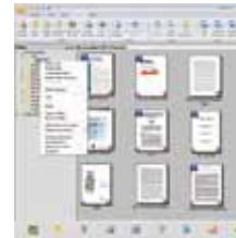
The PaperPort SE14 main screen

- La elección profesional para organizar y compartir sus Documentos